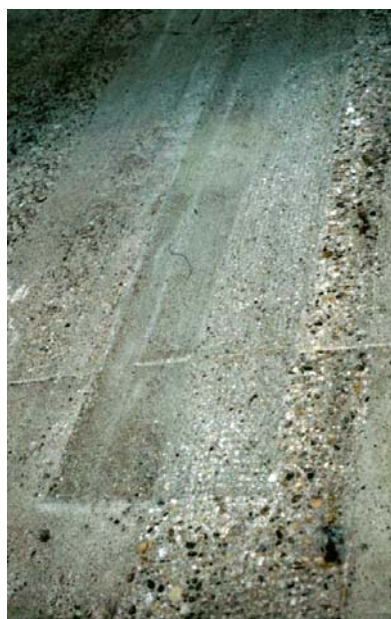
Reprofilierung im Detail