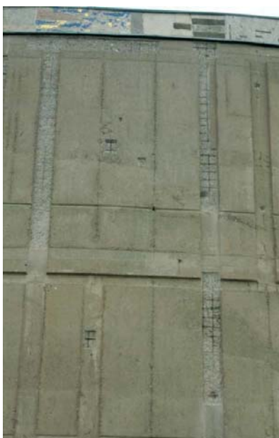
Schäden auf der Westseite