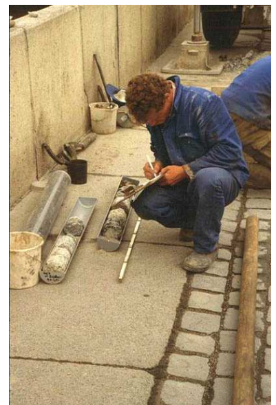
Bohrkernuntersuchung LGA Nürnberg