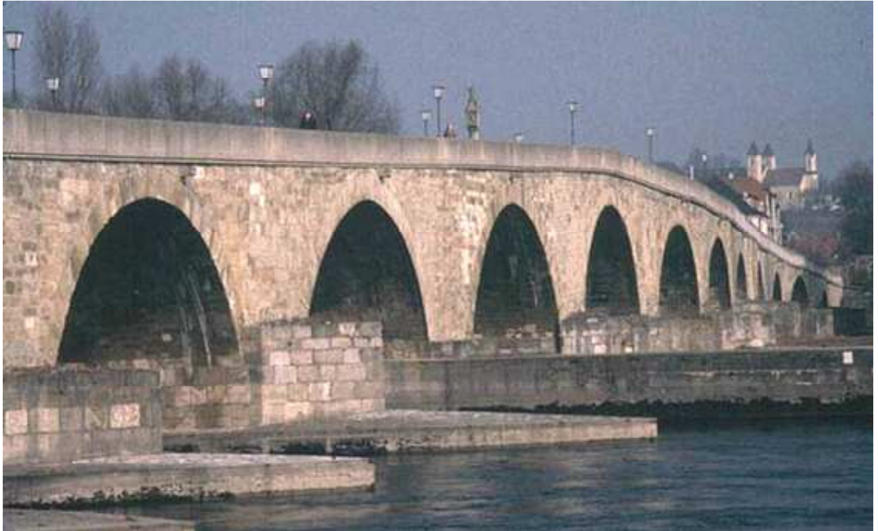
Ansicht von Südosten

Mitarbeit bei der Erstellung und Durchführung eines Untersuchungsprogramms zur Planung einer behutsamen Instandsetzung