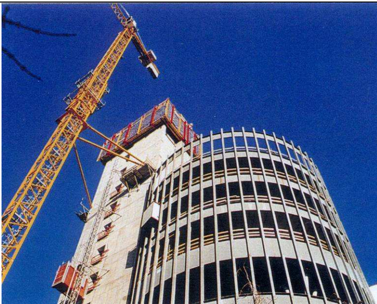
Bauzustand Dezember 1999