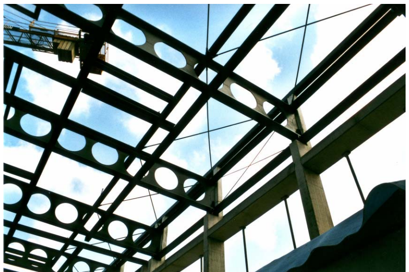
Anschluss der Stahlträger des Daches an Stahlbetonstützen