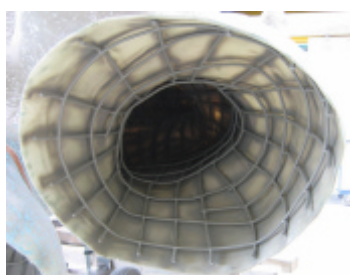
Blick in neuen rechten Arm