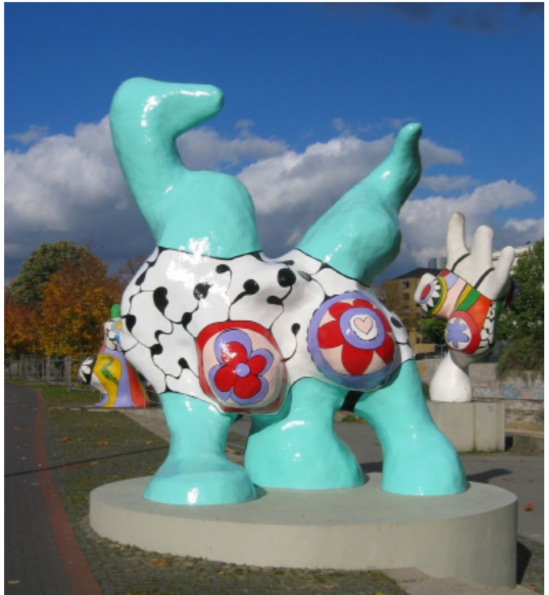
Vorderansicht nach der Wiederaufstellung 2004