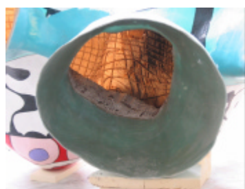
Blick durch den Kopf in die Plastik