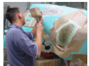
Reparaturen am linken Fuß