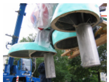
Arme mit Verankerung als Steckverbindung