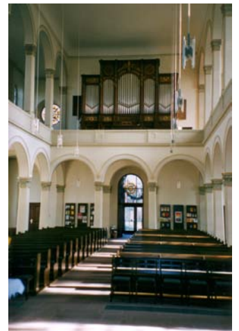
Blick nach Osten