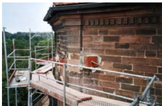
Statische Sicherungen, später unsichtbar