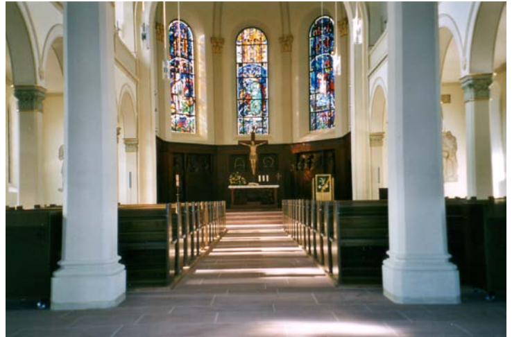
Blick nach Westen