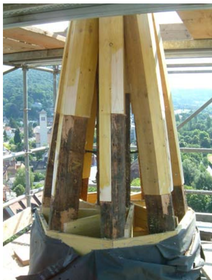
Reparatur Kaiserstiel und Sparren am Turm