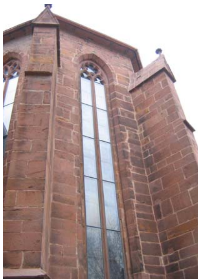
Gotischer Chor nach Instandsetzung