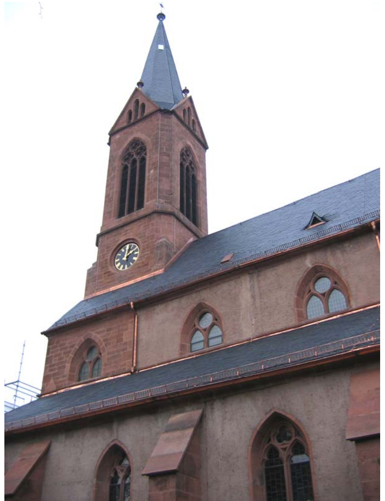
Südfassade nach Instandsetzung