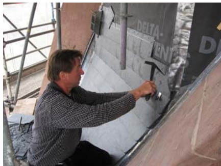
Erneuerung Schieferdeckung am Turm