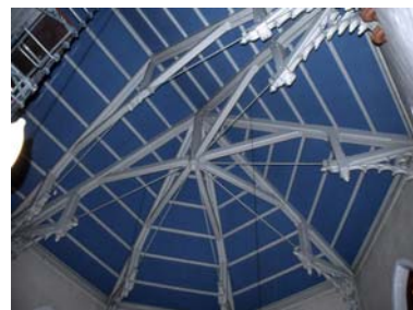
Decke Chor vor Renovierung