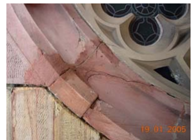
Schaden am Maßwerk