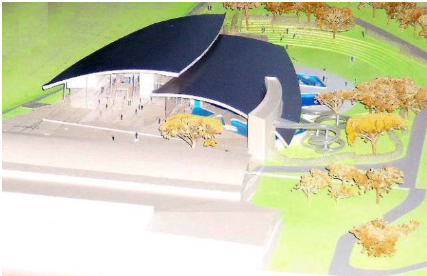
Modell: Haupteingang im Norden