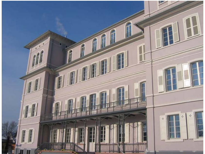
Südansicht Dezember 2008