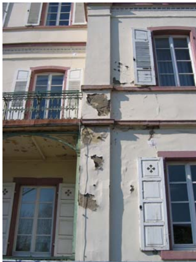
Ausschnitt Südfassade 2006