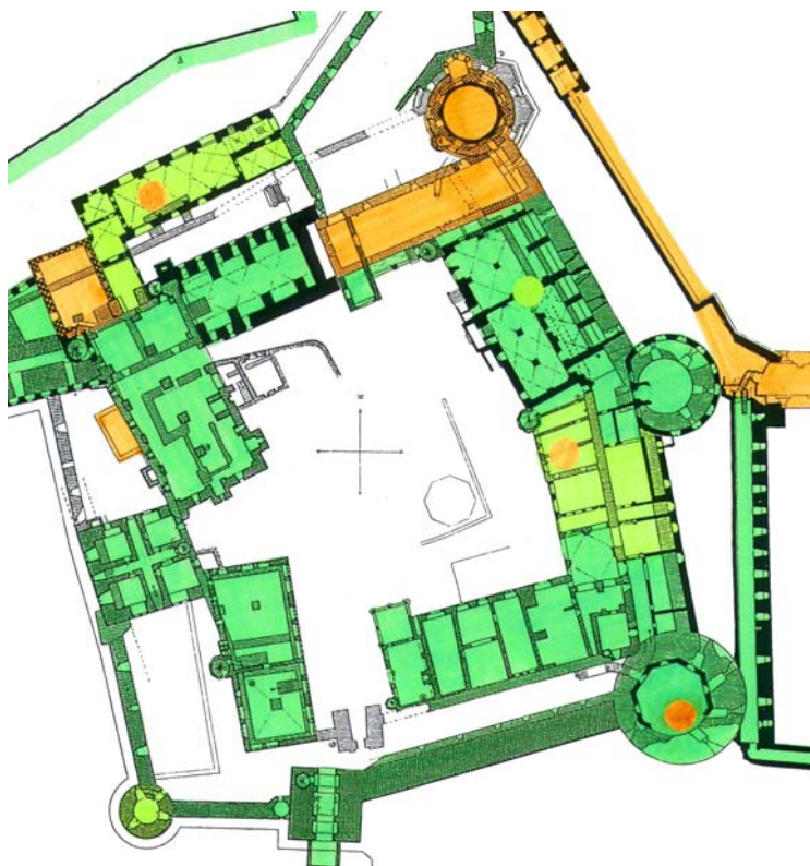
Übersichtsplan erforderlicher Maßnahmen

grün: kein Handlungsbedarf gelb: handwerkliche Reparaturen im Rahmen des Bauunterhalts orange: grundlegende Sicherungs- und Instandsetzungsmaßnahmen