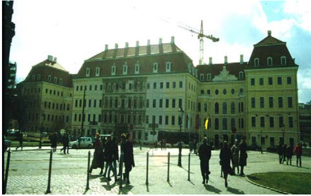
Fertiggestelltes Hotel (Nordseite mit Haupteingang)

Wiederaufbau der Sächsischen Thronfolgerresidenz zum Grandhotel Beratung und Tragfähigkeitsuntersuchungen