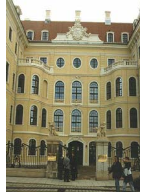
Westl. Ehrenhof: fertig-gestellter Haupteingang