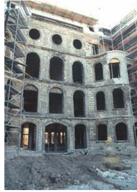
Westl. Ehrenhof: Bauzustand