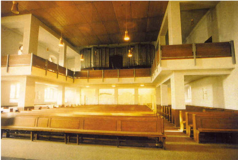
Emporen, Decken und Orgel im Anbau 1999