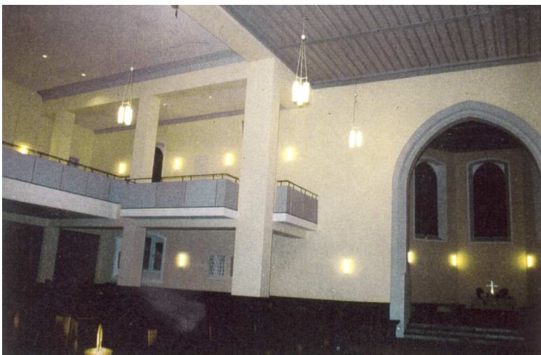
Ergebnis der Umbaumaßnahmen 2001 vor Einbau der neuen Orgel

Die mittelalterliche Kirche wurde im Jahr 1931 durch einen Anbau nach Norden erweitert. Durch einen Umbau im Jahr 1974 verloren der alte Kirchenraum und der Anbau ihren Charakter. Archivforschungen und restauratorische Untersuchungen ergaben, dass die Gestaltung vor 1974 im Altbau dem gotischen Stil und im Anbau den Zielen des Bauhauses entsprachen.