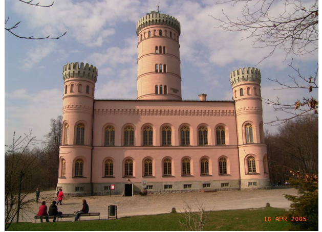
Ansicht des Schlosses

Bearbeiter Dr.-Ing. R. Käpplein Auftraggeber Betrieb für Bau und Liegenschaften Werderstraße 4 19055 Schwerin