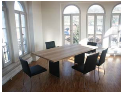
Trazzimmer 3. OG