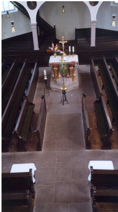
Chorraum vor der Renovierung

Neue Prinzipalstücke: M. Fuchs und C. Beysser 69234 Balzfeld