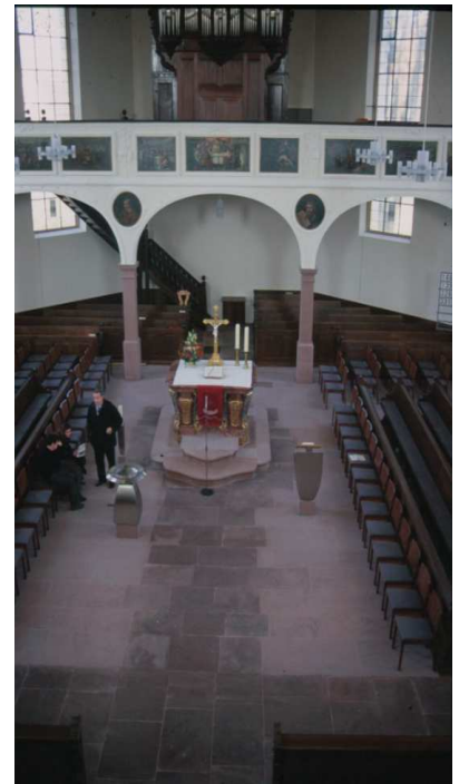
Chorraum nach der Renovierung

Bauliche und restauratorische Maßnahmen in der 1764 erbauten Ev. Barockkirche - Erweiterung des Freibereiches um den Altar und Freistellung der Stützen der Orgelempore. - Additive Verbreiterung des Altarpodestes. - Herauslösen der Konturen des in den Kirchenraum eingestellten Turmschaftes aus den Einbauten von 1911 unter der Westempore. - Verbessern der Begehbarkeit der Treppen zu den Emporen durch differenzierte bauliche Veränderungen.