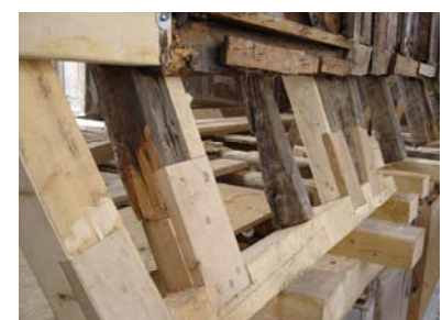
Reparatur Mansarddach WG