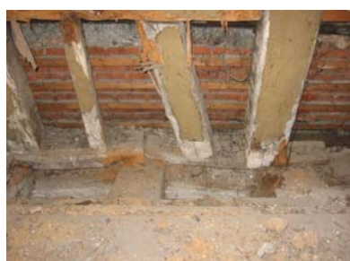
Schäden Mansarddach WG