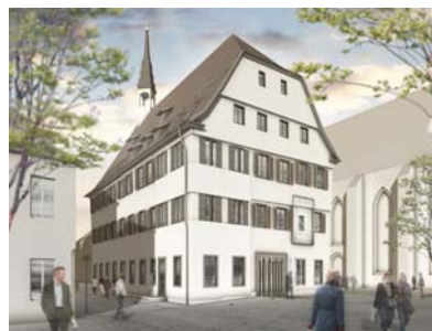
Ansicht von Südost (Rendering Architekturbüro Manderscheid Partnerschaft)