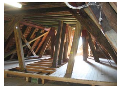
Blick in einen Teil des Dachgeschosses