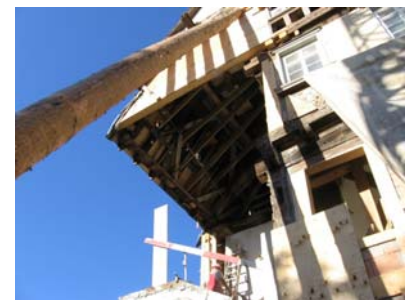
Bauzustand „Rückbau des nicht bauzeitlichen Treppenhauses in der SO-Ecke“